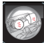
Túi khí dành cho người lái và hành khách