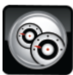
Bảng đồng hồ Optitron (3.0G)