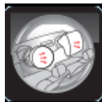
Túi khí dành cho người lái và hành khách